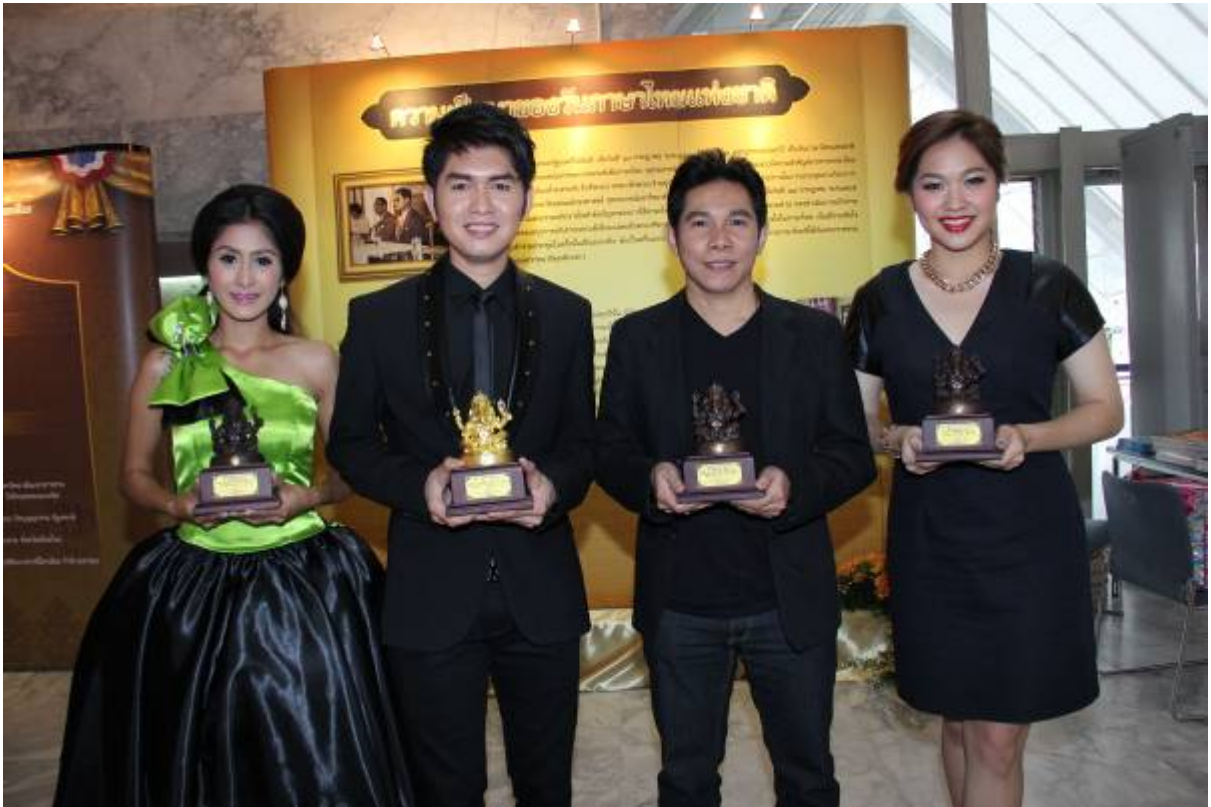
ศิลปินอาร์สยามเข้ารับรางวัล เพชรในเพลง เนื่องในวันภาษาไทยแห่งชาติ ประจำปี 2557 ซึ่งจัดโดย สำนักวรรณกรรมและประวัติศาสตร์ กรมศิลปากร